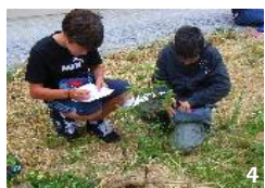
1: Sortie sur le sentier botanique de Montlaur « la clef des champs » 2 : Étiquette de parrainage d'arbre 3 : Inauguration du sentier botanique de Plaisance réalisé avec les enfants 4 : Au printemps, observation de la haie plantée par les enfants l'hiver