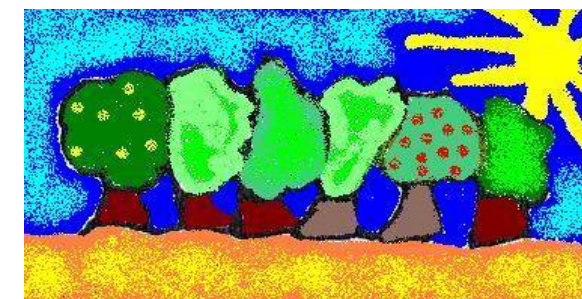
Dessins réalisés par les enfants de l'école de Montlaur