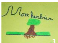
1: Atelier « description des feuilles » 2 : Couverture d'un herbier 3 : Panneau magnétique « Parcs et jardins »